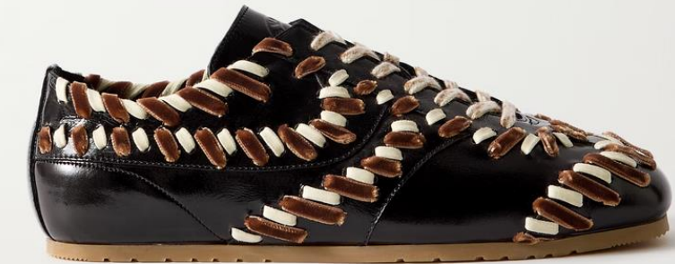
DRIES VAN NOTEN