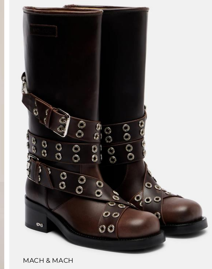
MACH & MACH